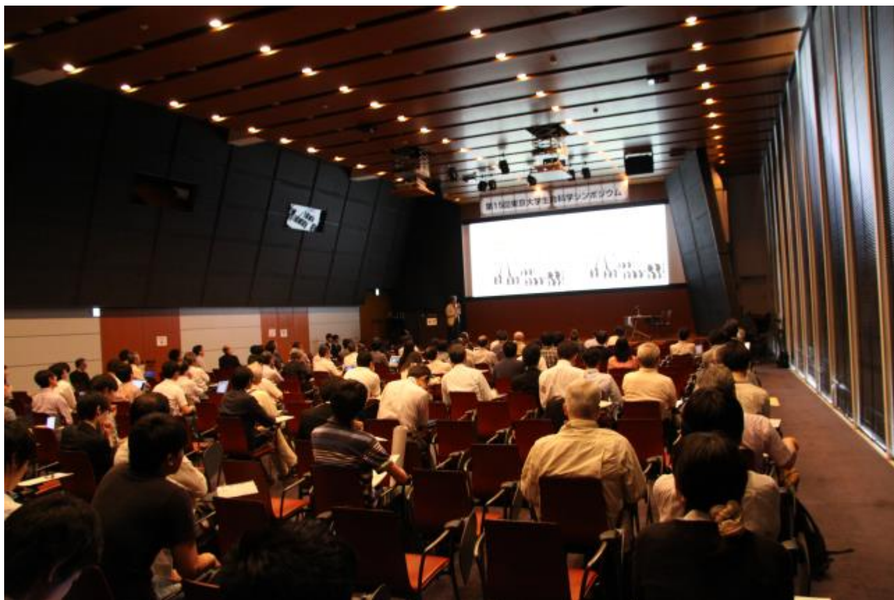
講演会場メインスクリーンに、講演スライド広告を流します。（昨年の会場の写真）